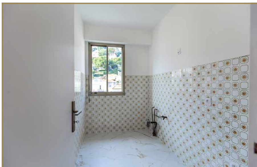
Dégagement & Entrée