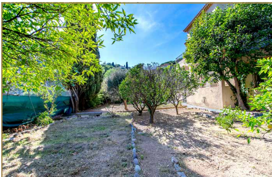
Jardin - espace facilement piscinable