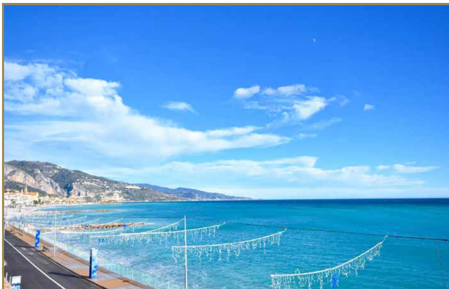
— Balcon du Séjour Veu Mer