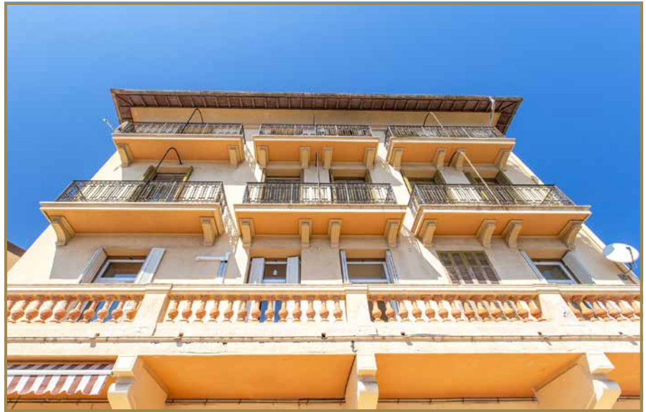
Vue Panoramique Mer