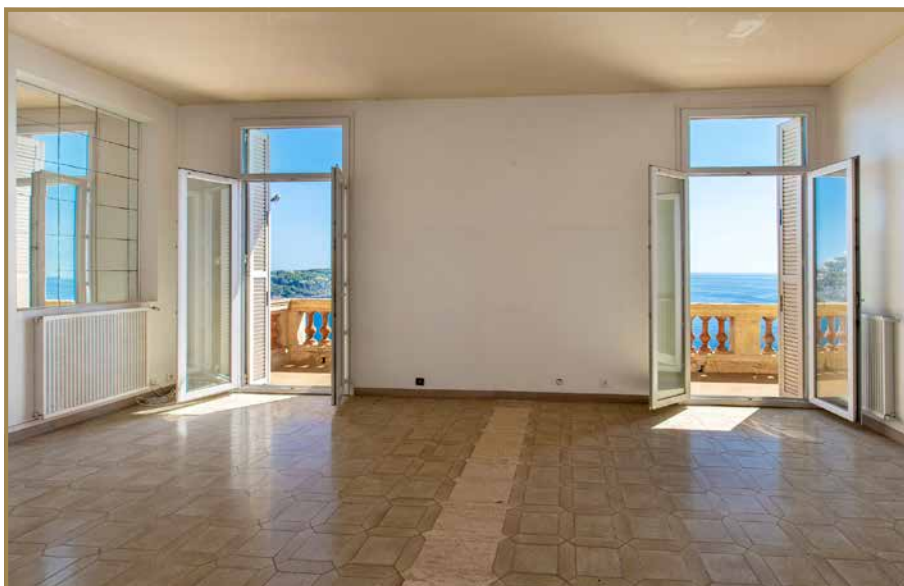
Terrasse du Séjour RDC