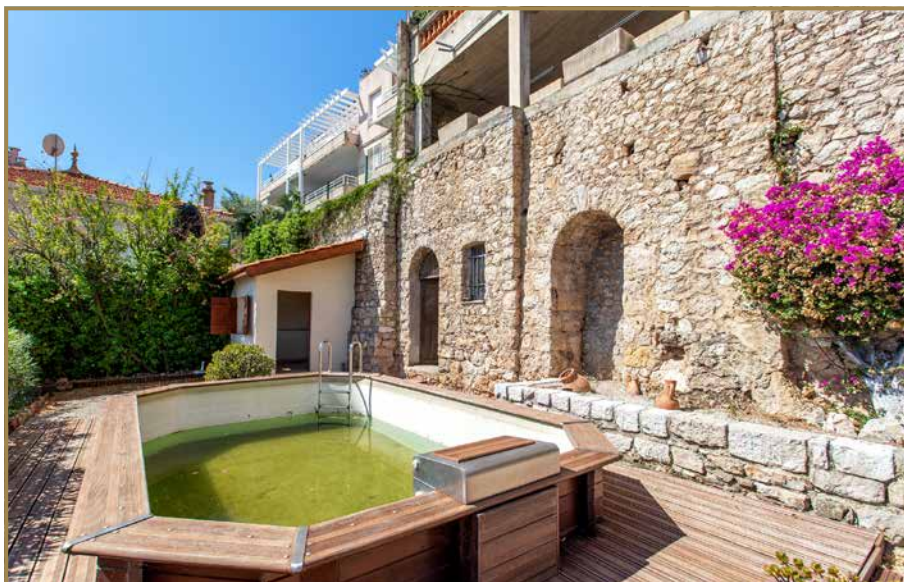
Extérieur de la Villa