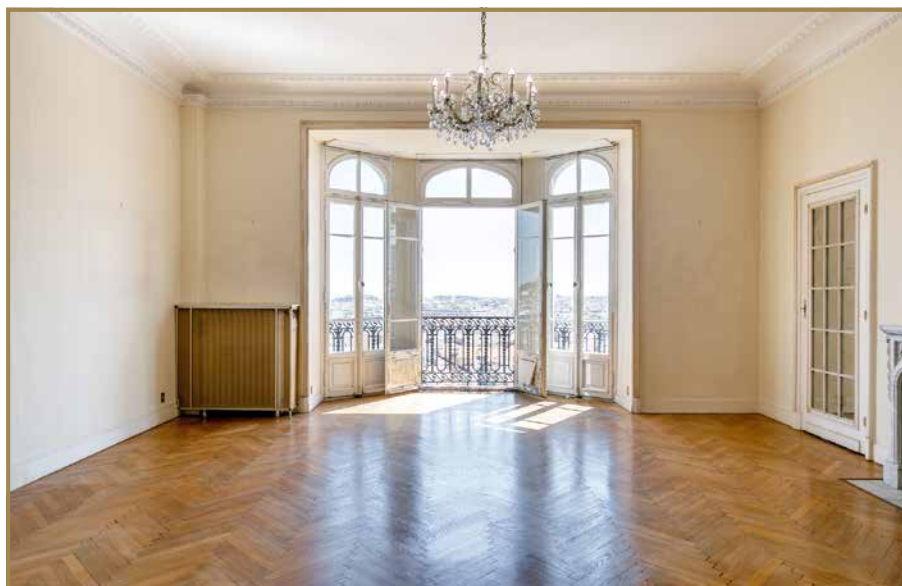
Vue panoramique Séjour