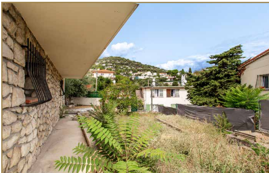
Extérieur du Garage